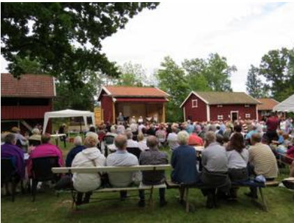
Uppskattningsvis 300 personer såg och hörde de så väl gestaltade rollerna i teateruppsättningen. Skådespelare och statister gjorde ett mycket uppskattat jobb! Publiken applåderade hjärtligt!